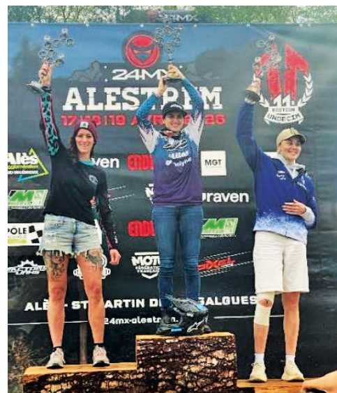
Das erste WM-Treppchen: 2. Platz World Championship in Frankreich

Bei bestem Wetter und fast schon sommerlichen 26 Grad konnte ich endlich zeigen, was in mir steckt. Steile Auf- und Abfahrten, steiniges Gelände, Felsvorsprünge, schnelle Singletrails und viele Hindernisse meisterte ich mit Bravour. Schließlich konnte ich mir mit dieser Leistung den zweiten Platz in der Weltmeisterschaft sichern. Ein Auftakt, mit dem ich (am Ende dann) zufrieden war.