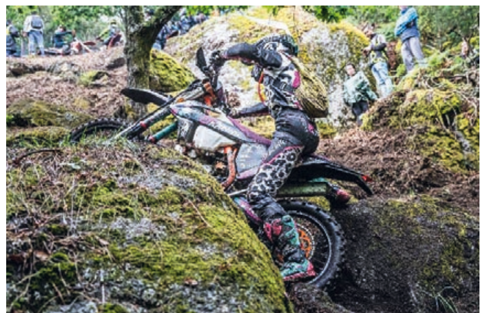
Materialschlacht beim XL Lagares

ich auch in Portugal erneut den zweiten Platz holen. Damit liege ich aktuell auf Rang zwei der Gesamtwertung in der Hard-Enduro-Weltmeisterschaft der Damen. Ein Ergebnis, mit dem ich niemals gerechnet hätte und über das ich unglaublich glücklich bin. Und genau deshalb war es mir wichtig, diesen Beitrag zu schreiben. Hinter jedem Rennen stehen nicht nur die Fahrer selbst, sondern Menschen, die mit genauso viel Leidenschaft mitarbeiten, mitfeiern und unterstützen.