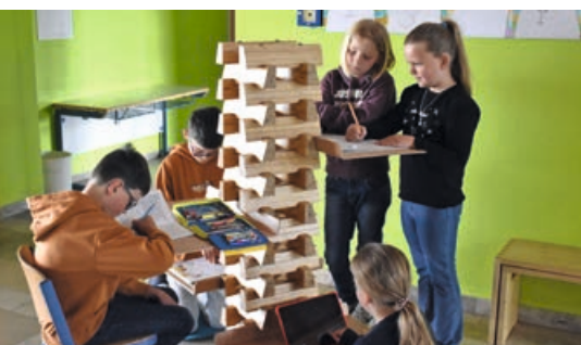
GRUNDSCHULE DENKLINGEN EIN NEUES MÖBELSTÜCK MACHT SCHULE