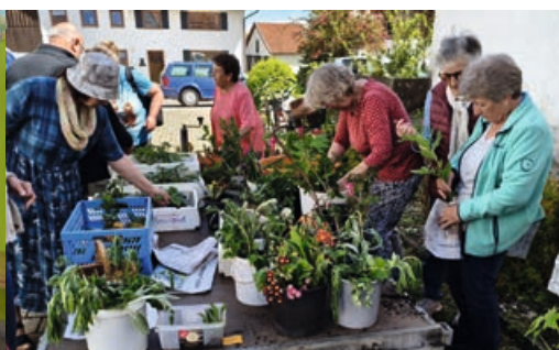
PFLANZENTAUSCH 2026 MIT WETTERGLÜCK