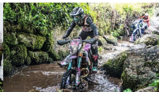
HARD-ENDURO-WM SCHLAMM, REGEN & REPARATUREN