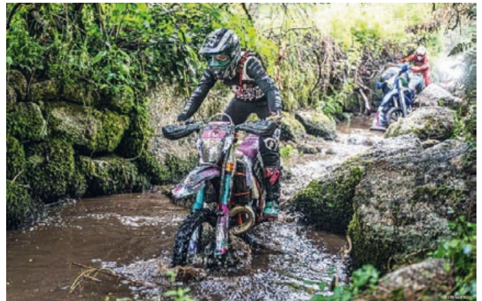
Im Bachbett von Lagares – Portugal

Die letzten beiden Fahrtage hatten es zusätzlich wettertechnisch in sich. Dauerregen, rutschige Auf- und Abfahrten, tiefer Schlamm und extrem anspruchsvolles Gelände machten jeden Kilometer zur Herausforderung. Teilweise mussten die Motorräder geschoben oder aus dem Schlamm mit den Händen ausgegraben werden. Flussbetten mit 3 Meter hohen Holzrampen, die man runterfahren sollte. Und dann mit dem Vorderrad im Wasser landen, wo man nicht weiß, was da drunter ist ... Auffahrten – so ausgefahren, dass man mit den Fußrasten stecken bleibt; so pulvrig weicher Dreck und gleichzeitig so steil, dass keine Traktion aufgebaut werden kann und das Hinterrad dauerhaft durchdreht. Körperlich und mental war das Rennen wahrscheinlich eines der anstrengendsten, das ich bisher gefahren bin. Das Ergebnis danach: unzählige blaue Flecken und Schürfwunden, eine große Brandblase, kaum Schlaf – aber unglaublich viel Stolz. Denn trotz aller Schwierigkeiten konnte