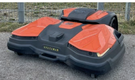
VFL DENKLINGEN NEUER MÄHROBOTER