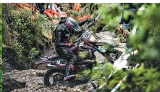
MOTORSPORT EINE EPFACHERIN IM HARD ENDURO