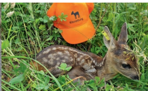
KITZRETTUNG WIR BENÖTIGEN DRINGEN UNTERSTÜTZUNG