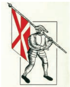
Die gemeinsame Fahne der Allgäu-schwäbischen Bauernhaufen.

Im Frühjahr 1525 kam der in die Geschichte eingegangene Aufruhr des Bauernstandes (zu dem damals 80 Prozent der Bevölkerung zählten und alle auf dem Lande lebenden Personen verstanden werden) gegen die Obrigkeit (Adel, Klöster und Stifte) auch bei uns zum Ausbruch, der sich, vom Oberallgäu ausgehend, wie ein Flächenbrand bis nach Mitteleuropa ausbreitete. Er hatte seine Ursachen in überhandnehmenden Konflikten wegen der Willkür von vielen und hohen Abgaben, Drangsalierungen sowie in der massiven Einschränkung von Menschen- und Freiheitsrechten. Zusätzliche klimatische Auswirkungen, die zu schlechten Ernteergebnissen führten, brachten viele Bauern an den Rand des Existenzminimums. Da die Obrigkeit nicht willens war, auf deren Forderungen, die unter Berufung auf