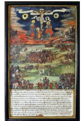
Votivbild, geschaffen von Erwin Holzbaur, in der Kleinkitzighofener Bauernkapelle, welches an das damalige Geschehen erinnert.

Neben weiteren Büchern zum Bauernkrieg, sind für Interessierte zwei Bücher zu empfehlen, die sich neben dem Ablauf speziell mit den regionalen Ereignissen befassen und im Buchhandel erhältlich sind: Stefan Fischer : Aufuhr im Allgäu – Kleine Geschichte des Bauernkriegs 1525 , Verlag Friedrich Pustet Regensburg, ISBN: 978-3-7917-3519-1. Reinhard Baumann : Allgäuer Freiheit – Bauernfreiheit und Bürgerfreiheit, der Kampf um die Freiheit, nicht nur im Bauernkrieg von 1525 , Verlag Hans Högel KG, Mindelheim, ISBN: 978-3-947423-57-6