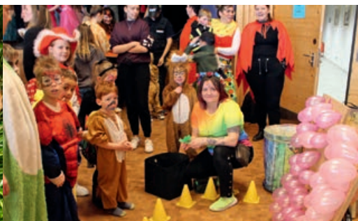
KINDER- UND FAMILIENFASCHING Denklingen 2025