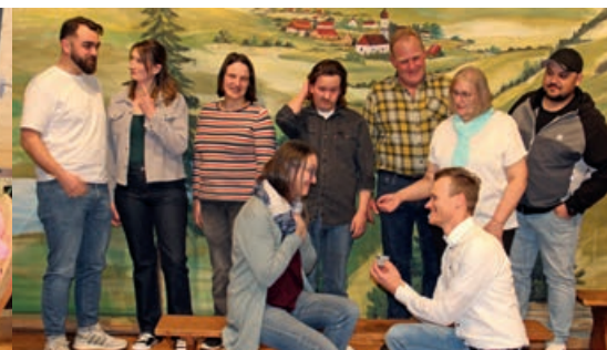
„LECHROANER“ EPFACH E.V. Theater in Epfach