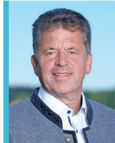
Andreas Braunegger Erster Bürgermeister