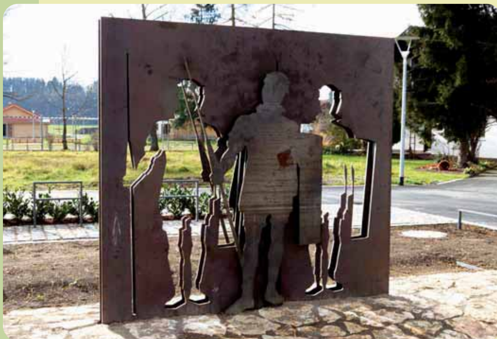
Die neu erstellte Skulptur am neuen Baugebiet in Epfach