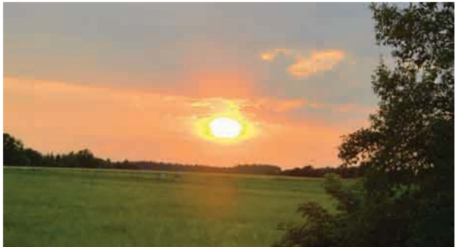
Sonnenuntergang überm Vogelherd im Juli 2010