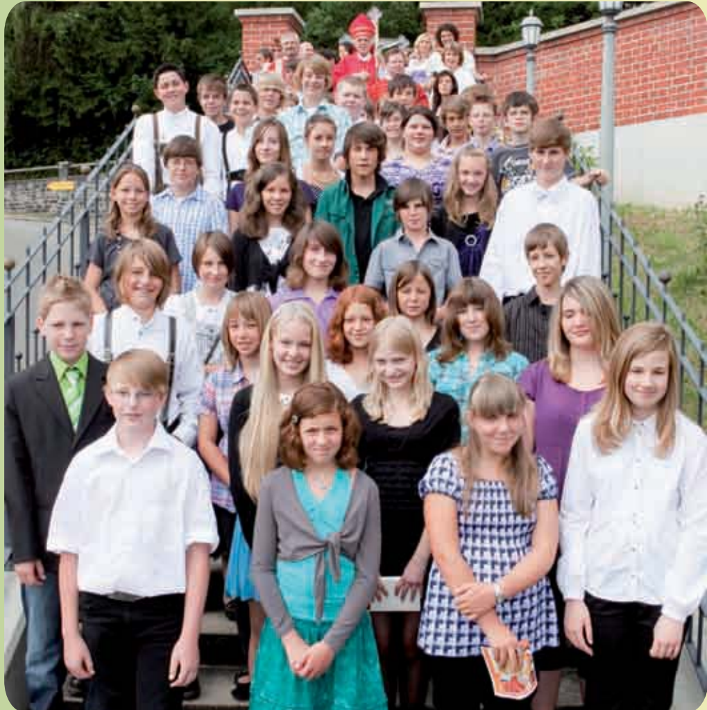
Die Firmlinge der Pfarreiengemeinschaft Fuchstal