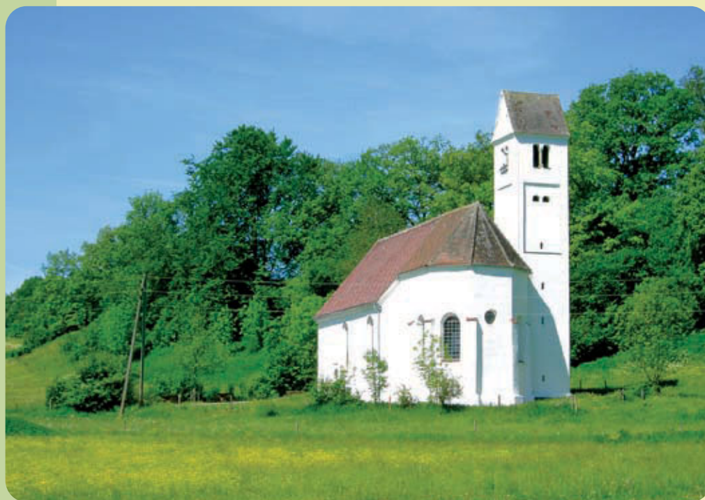
40 Jahre Wiederaufbau der Osteraufkirche