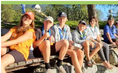
SÜDTIROLFAHRT 2023 des VCP Stamm Lechain e. V.