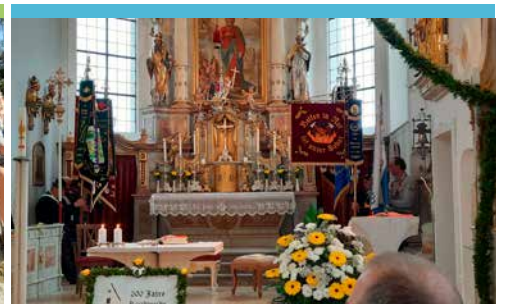
200 JAHRE KIRCHWEIH am 15. Oktober 2023 in Epfach