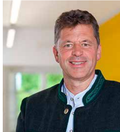
ANDREAS BRAUNEGGER Erster Bürgermeister