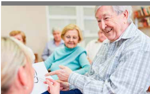
EUTB BERATUNG für Bürgerinnen und Bürger